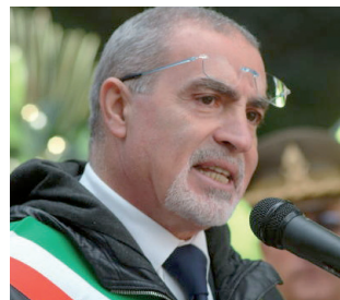
IL SINDACO ROCCO D'AURIA

E' una tariffa di igiene ambientale. Una tas-